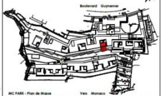
MC PARK - Plan de Masse